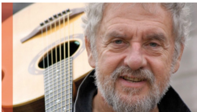
Gilles Servat (poète Breton)

Des générations d'hommes naissent et meurent pendant votre vie, vous êtes la sagesse face à la folie, la durée devant l'éphémère, le stable devant le passager